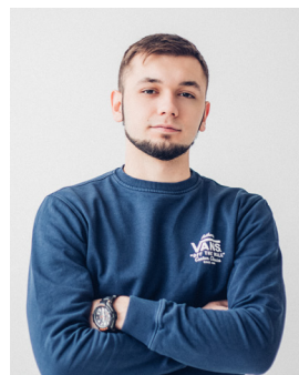
Владислав бізнес девелопмент