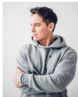
Андрій SMM Спеціаліст